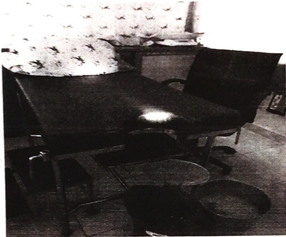
ภาพกิจกรรมการดำเนินงานตามโครงการคัดกรองโรคจากมะเร็งปากมดลูกและมะเร็งเต้านม ตำบลสระแก้ว อำเภอเบญจน้อย จังหวัดขอนแก่น ปี ๒๕๖๔