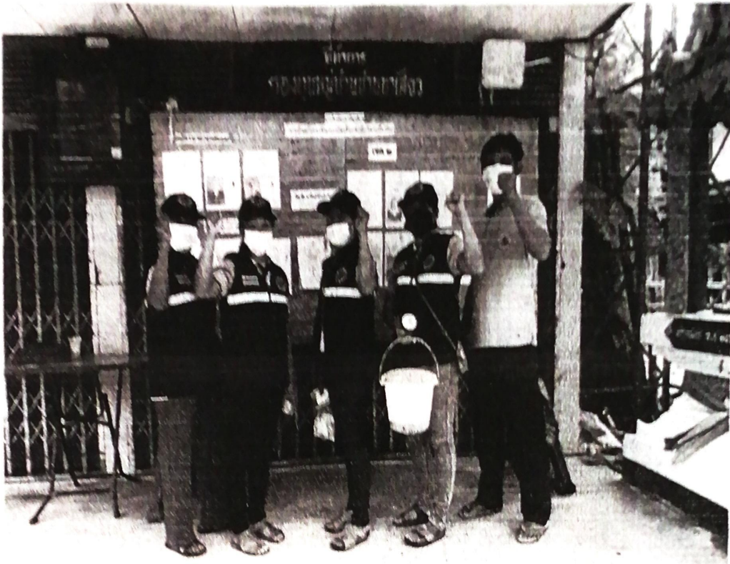
ภาพกิจกรรมการดำเนินงานตามโครงการเฝ้าระวังป้องกันและควบคุมโรคไข้เลือดออก ตำบลสระแก้ว อำเภอเบญจน้อย จังหวัดขอนแก่น ปี ๒๕๖๔